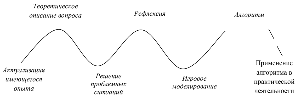
Рисунок 2. – Использование переходов «теория – практика» и «практика – теория» в образовательной деятельности по формированию педагогической компетентности родителей

На рисунке 2 показано использование переходов «теория – практика» и «практика – теория» в образовательной деятельности по формированию педагогической компетентности родителей.